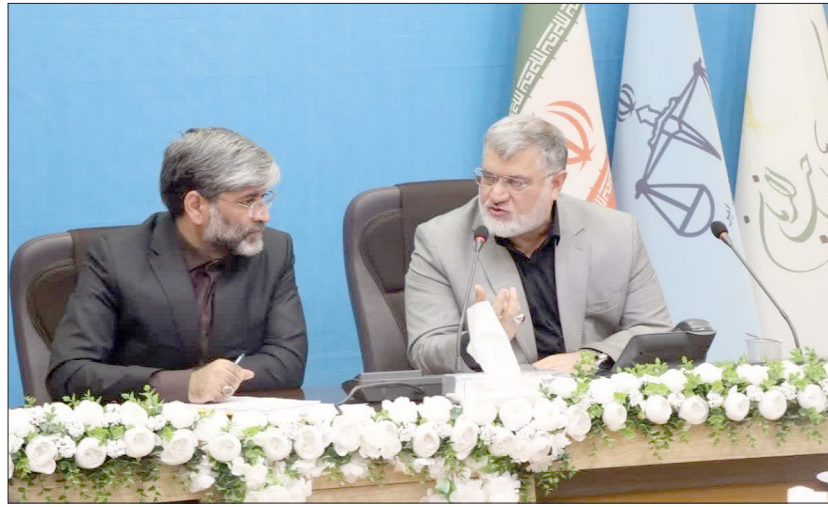
پرداخت و گفت: با تلاش های قرارگاه شهید سلیمانی، تاکنون ۷۰ درصد اراضی کشاورزی تثبیت مالکیت شده