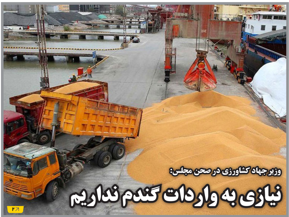
وزیر جهاد کشاورزی در صحن مجلس: