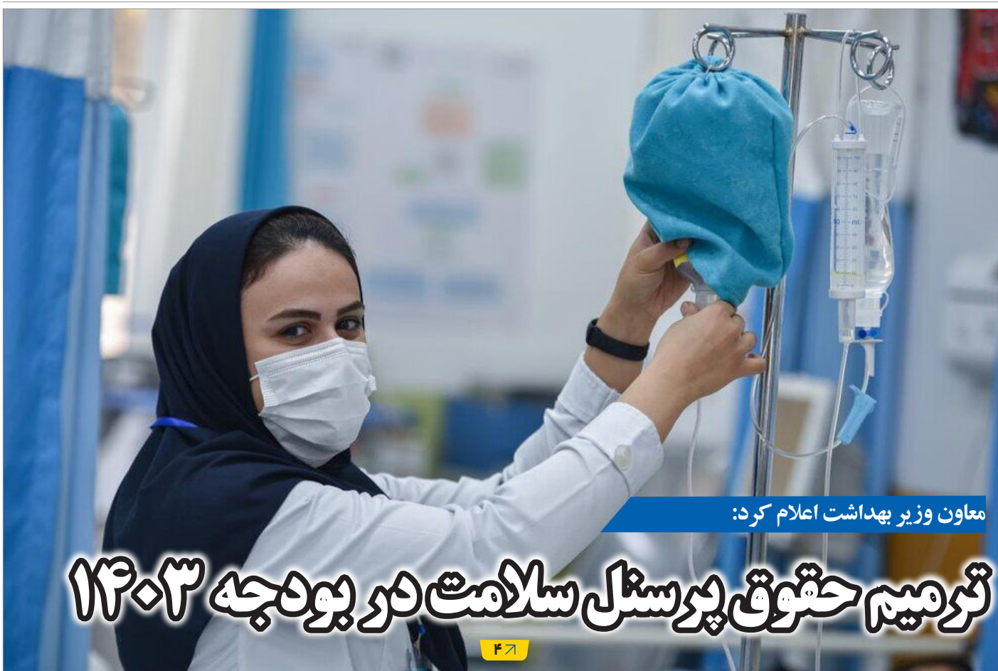
معاون وزیر بهداشت اعلام کرد: