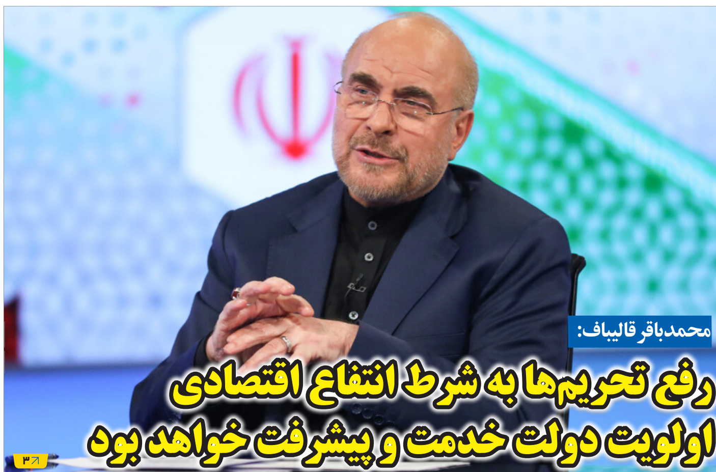
محمد باقر قالیباف:

رفع تحریم‌ها به شرط انتفاع اقتصادی اولویت دولت خدمت و پیشرفت خواهد بود