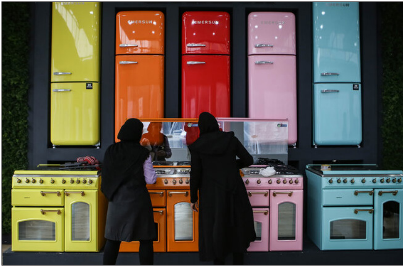
لوازم خانگی خارجی است

لحظه ثبت سفارش تا تحویل در گمرکات بالاست، اما سعی شده است تا کالایی با کیفیت بالا و قیمت مناسب در اختیار مردم قرار گیرد.