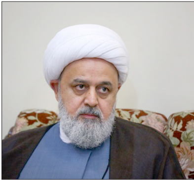
دبیرکل مجمع جهانی تقریب مذاهب اسلامی در نشست خبری خود.

دبیر کل مجمع جهانی تقریب مذاهب اسلامی در خصوص عملکرد دولت پزشکیان در راستای وفاق ملی نیز گفت: من معتقدم یک فرصت بسیار استثنایی با این ذخیره انقلاب که آقای پزشکیان هست برای ما به وجود آمده و الحمدلله سرمایه اجتماعی که خیلی از دست رفته بود، الآن آهسته آهسته در همین مدت کم در حال بازگشت است. نخبگان جامعه همه امیدوار شده‌اند که ان شاء الله این تغییرات موجب تحولی در زندگی همه شهروندان شود.