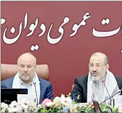
رئیس مجلس شورای اسلامی در جریان نشست با اعضای هیات رئیسه دیوان محاسبات کشور.

وی با بیان اینکه بودجه‌ای که دولت می‌دهد باید بر اساس اولویت‌ها انجام شود، تصریح کرد: امسال نیز در سال نخست اجرای برنامه هفتم توسعه قرار داریم و همین امسال باید گزارش‌های دیوان محاسبات کشور بر اساس همین برنامه تنظیم شود و نظارت لازم را انجام دهد.