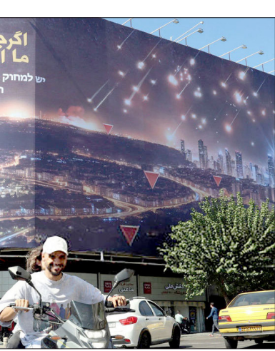
یک مرد در تهران، یک تابلوی تبلیغاتی را در یک خیابان حمل می‌کند.

جنبش حزب‌الله، همراه با دیگر گروه‌های متحد ایران در خاورمیانه – مانند گروه‌های شیعه در عراق و حوثی‌ها در یمن- قابلیت‌های نظامی خود را تقوا توسعه دادند. توانمندی‌های استراتژیک این گروه‌ها همچنین این درک را در ایران عمیق‌تر کرد که آن‌ها یک بازدارندگی قابل توجه علیه اسرائیل ایجاد می‌کنند و به یکی از اجزای اصلی امنیت