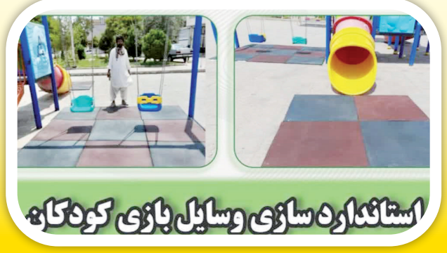
استاندارد سازی وسایل بازی کودکان