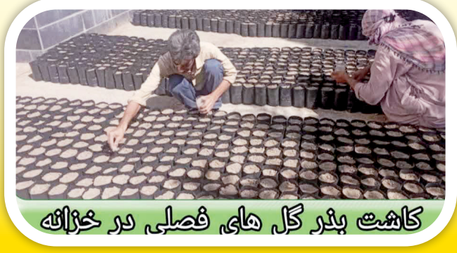
کاشت پتار گل های فصلی در خزانه