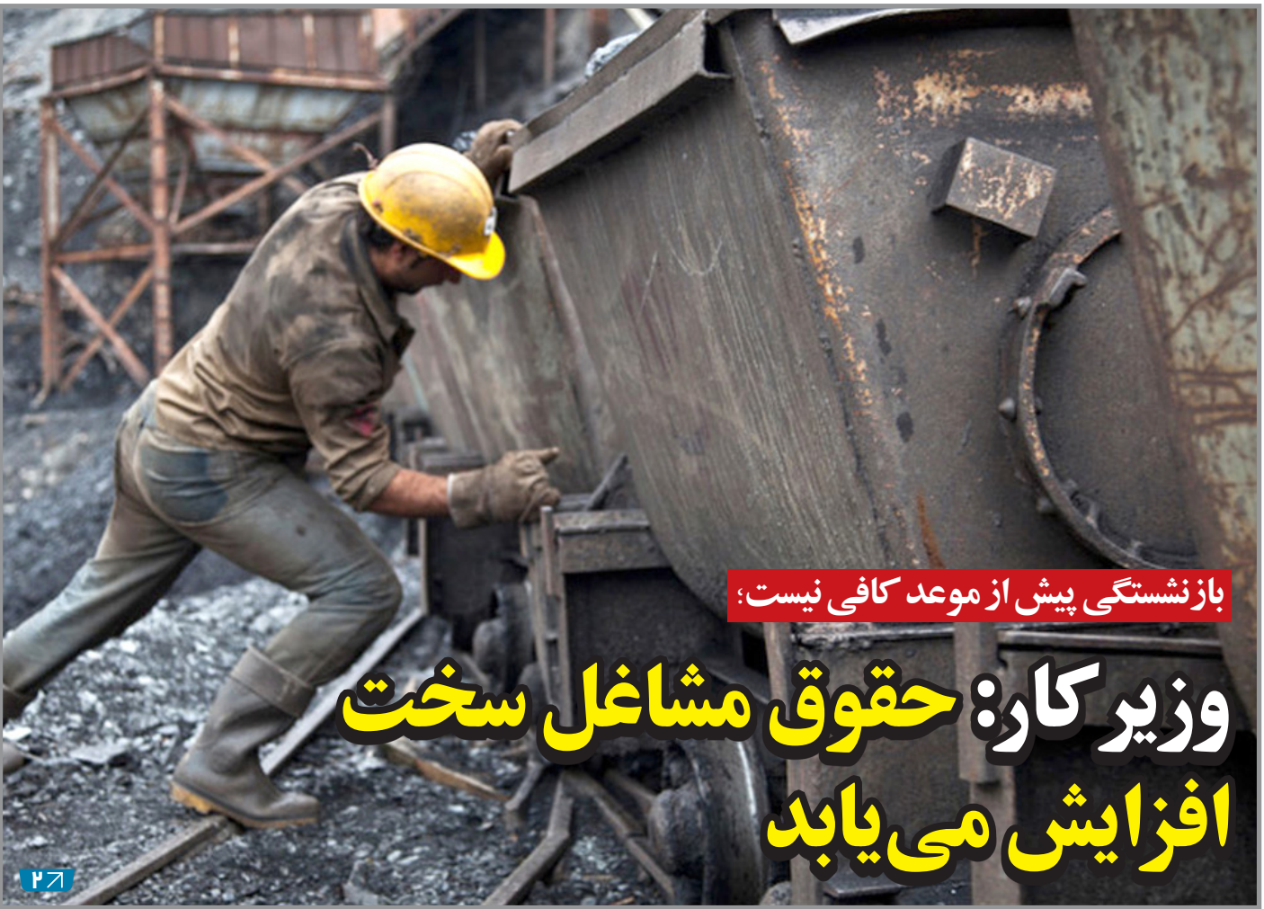
بازنشستگی پیش از موعد کافی نیست؛