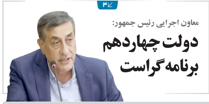
معاون اجرایی رئیس جمهور: دولت چهاردهم برنامه گراست

سخنگوی دولت با بیان این که وزارت کشور به عنوان متولی امور اتباع، مأموریتی برای شناسایی این افراد دارد، گفت: هم اکنون نسبت اتباع غیرمجاز به مجاز بیشتر است، لذا وزیر کشور در پی مدیریت اتباع و دیوارکشی مرزی است. به گزارش ایرنا، فاطمه مهاجرانی در نشست خبری روز گذشته در پاسخ به سوالی درباره موضوع اتباع غیرمجاز گفت: موضوع اتباع موضوعی است که در کل دنیا به عنوان یک موضوع پذیرفته شده با آن برخورد می شود، وقتی مسا موضوعی را می پذیریم یعنی اینکه برای آن ساز و کار ایجاد می کنیم و نهاد و سازمانی را متولی امور آن می دانیم و بعد مجاز را از غیرمجاز تفکیک می کنیم. مهاجرانی گفت: شناسایی اتباع مجاز و قانونی که افراد بسیار شریفی هستند مهم است، در میان این عزیزان شاعر و محقق، مهندس و سرمایه دار داریم و افرادی را هم داریم که غیرمجاز هستند، نسبت این ها با هم نسبت معناداری نیست، نسبت اتباع غیرمجاز ما به مراتب از نسبت اتباع مجازمان بیشتر است و به همین دلیل وزیر کشور در حال ساماندهی افراد و به عبارتی خارجی کردن اتباع غیرمجاز و دیوارکشی در مرز هستند.