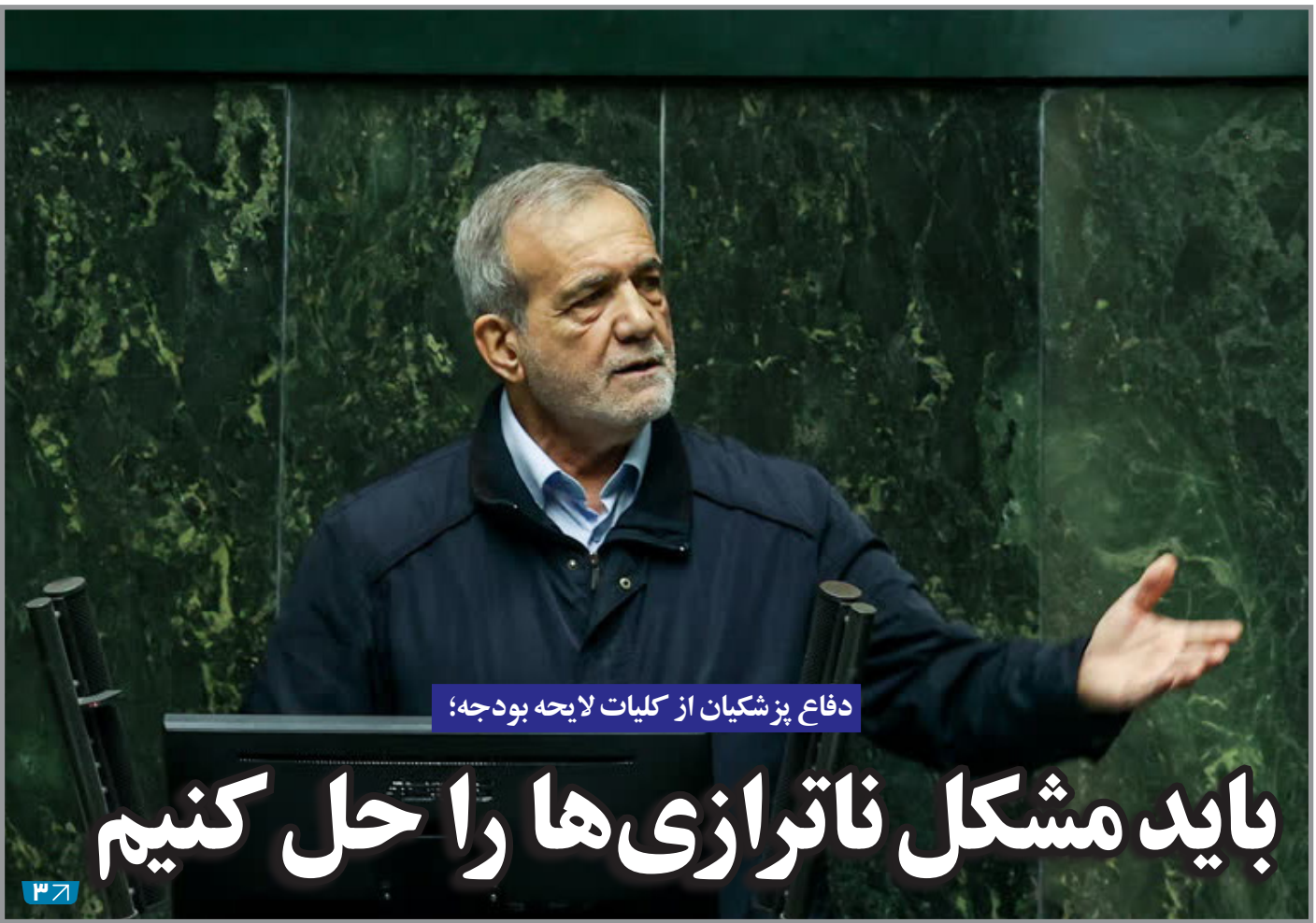
دفاع پزشکیان از کلیات لایحه بودجه؛

گزارش اخیر مرکز پژوهش های مجلس بیانگر این است که یک سوم ایرانی ها زیر خط فقر هستند و به گفته نمایندگان کارگری قدرت خرید کارگران از ابتدای سال تا امروز نصف شده است. دیروز رسانه ها در گزارشی درباره دلایل اصلی مشکلات موجود و فقر فزاینده در ایران دو نکته را از سمت مرکز پژوهش های مجلس و رویکرد کارگری فعالان این حوزه مورد اشاره قرار داد.