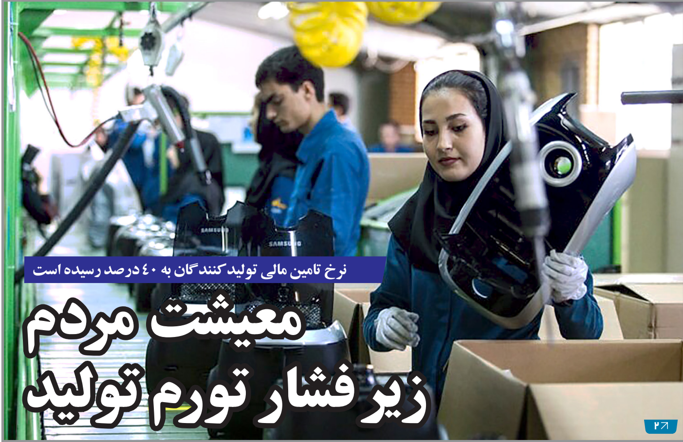
نرخ تأمین مالی تولیدکنندگان به ۴۰ درصد رسیده است

عصر رسانه - آرمان فتوری موضوع تقاضای مسکن در تهران و وعده‌های گذشته این بار سر از صحن شورای شهر درآورد و تبدیل به یک جنجال شد. زاکانی، شهردار تهران که بعد از خروج زودهنگام دولت سیزدهم از مسند اجرایی حالا زیر ذره‌بین مخالفان قرار گرفته و در ماه‌های گذشته چندین بار تخت تأثیر کمیسیون استیضاح و برکناری بوده، دیروز مورد سوال برخی اعضای شورای شهر قرار گرفت تا در قبال آنچه که از آن به عنوان قرارگاه مسکن در زمان دولت رئیسی مطرح شد و تبلیغاتی که شهرداری تهران برای آن داشت پاسخگو باشد. زاکانی طبق روال مرسوم با فرافکنی‌های متعصبانه، خود از زیر بار مسئولیت این قرارگاه شانه خالی کرد و عنوان کرد که ساخت مسکن وظیفه شهرداری تهران نیست و این مسئولیت را دولت برعهده دارد. در حالیکه اعضای شورای شهر معتقدند او بنا همسکاری و همراهی دولت قبل با راهاندازی موضوع ساخت مسکن از طرف مدیریت شهری توقعاتی ایجاد کرد که نتوانست آنها را برآورده کند. دیروز این بحث داغ شد و رئیس کمیته سلامت شورای شهر تهران با طرح سوال از شهردار تهران درباره سرانجام ساخت ۲۰۰ هزار واحد مسکونی در پایتخت، گفت: «وعده‌های شما در خصوص مسکن توقعاتی ایجاد کرده است، شما بنا وعده‌های خلاف واقع، انتظار آتی برای شهروندان به وجود آوردید که باعث بی‌اعتمادی شهروندان تهرانی به مجموعه مدیریت شهری شده و می‌شود».