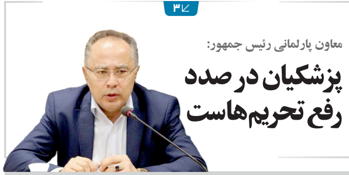
معاون پارلمانی رئیس جمهور: