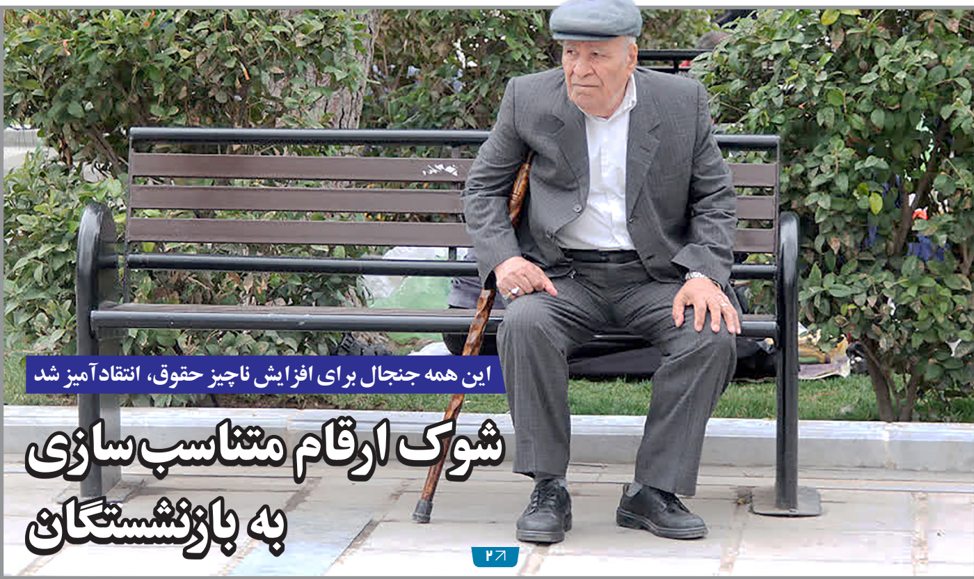
این همه جنجال برای افزایش ناچیز حقوق، انتقاد آمیز شد شوک ارقام متناسب سازی به بازنشستگان

بررسی داده‌های آماری نشان داد سقوط معاملات مسکن به کف ۱۶ سال قبل بر اساس داده‌ها تابستان امسال نسبت به سال قبل بازار کار کمی رونق داشته است پراکندگی بیکاری در کشور