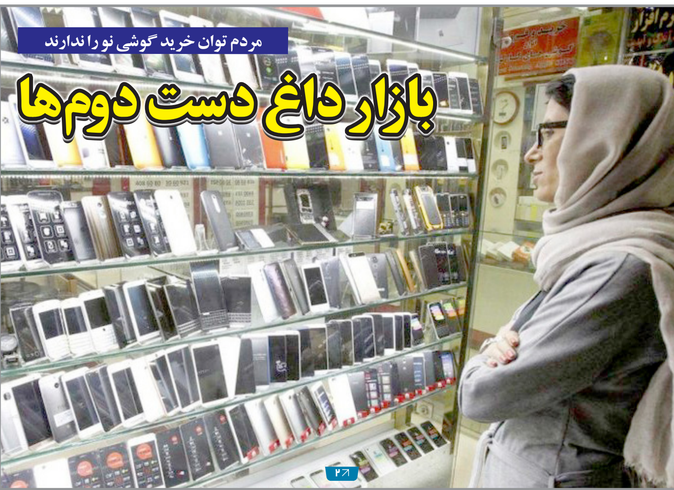
مردم توان خرید گوشی نو را ندارند