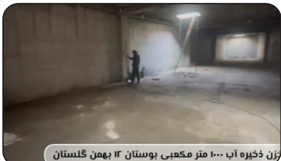
تان ذخیره آب ۱۰۰۰ متر مکعبی بوستان ۱۲ بهمن گلستان

شهرداری گلستان بعد از شهر تهران بعنوان اولین شهرداری در سطح شهرستان های استان تهران اقدام به بازگشایی دفتر توسعه و تسهیل گری بافت فرسوده کرده است این دفتر بمنظور ساماندهی بافت فرسوده و ایجاد اشتیاق به مالکین جهت بازسازی ملک فرسوده خود با ایجاد طرح های مختلف تخفیفی و معافیتی اعم از طرح تسهیلات ساخت، تامین پارکینگ و از همه مهم تر عوارض رایگان برای مالکین در این طرح تلاش خود را برای نوسازی چهره بصری شهر گلستان و تلاش برای ایجاد ایمنی هر چه بیشتر همچنین اصلاح شهرسازی بکار گرفته است این پروژه که در راستای بازآفرینی شهری در دستور کار مدیریت شهری و شورای اسلامی شهر گلستان قرار