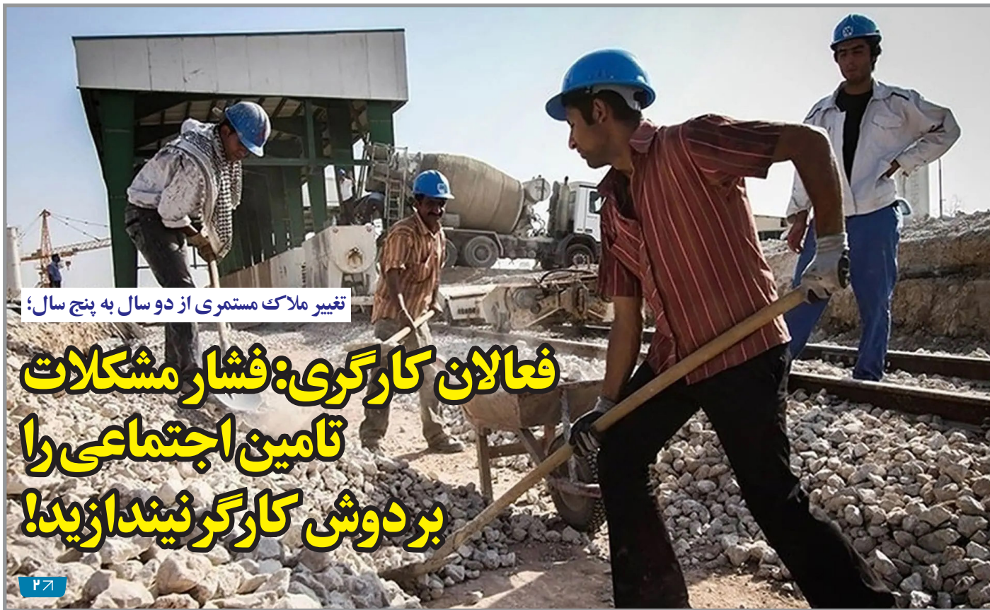
تغییر ملاک مستمری از دو سال به پنج سال؛