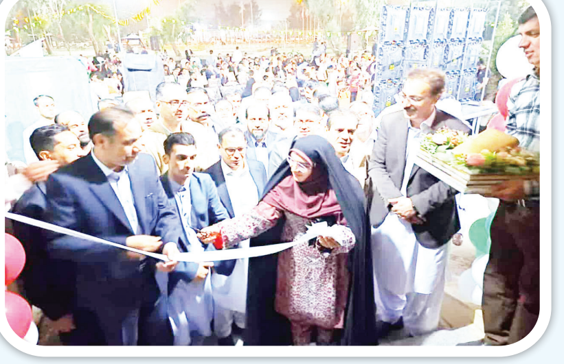
در جلسه شورای اسلامی مدیرکل دفتر امور شهری و شوراهای فرماندار شهرستان زاهدان، شهردار زاهدان، تاجند از مدیران و معاونین شهردار روند اجرای برخی از طرح‌ها و برنامه‌های در دست اقدام شهرداری زاهدان مورد بررسی و ارزیابی قرار گرفت. در این بازدید که از طرح سامانه‌های کناره گذر تقاطع غیرمهمسقط آیت الله سلیمانی و معابر محله شریعتی شمالی صورت گرفت ضمن تأکید بر اجرای باکیفیت امور ضرورت انجام برنامه‌ها در کمتترین زمان ممکن مورد توجه قرار داده شد. در انتهای این بازدید شهردار زاهدان ضمن ارائه گزارشی از روند اجرای امور، از اتمام جلوگیری معابر و نقاشی معابر و تقاطع غیرمهمسقط آیت الله سلیمانی در کمتر از یک ماه آینده خبر داد و گفت سامانه‌های و رفع مشکلات کنارگذر تقاطع غیرمهمسقط شهید آیت الله سلیمانی توسط هیئت ایت الله ولایتی و هیئت ایت الله معتمدی در دست اقدام قرار دارد که با عنایت به انجام مقدمات اولیه آن شایسته تعیین مهلت و اقدام لازم جهت تسهیل در تردد شهروندان است. در این بازدید که از طرح سامانه‌های کناره گذر تقاطع غیرمهمسقط آیت الله سلیمانی و معابر محله شریعتی شمالی صورت گرفت ضمن تأکید بر اجرای باکیفیت امور ضرورت انجام برنامه‌ها در کمتترین زمان ممکن مورد توجه قرار داده شد. در انتهای این بازدید شهردار زاهدان ضمن ارائه گزارشی از روند اجرای امور، از اتمام جلوگیری معابر و نقاشی معابر و تقاطع غیرمهمسقط آیت الله سلیمانی در کمتر از یک ماه آینده خبر داد و گفت سامانه‌های و رفع مشکلات کنارگذر تقاطع غیرمهمسقط شهید آیت الله سلیمانی توسط هیئت ایت الله ولایتی و هیئت ایت الله معتمدی در دست اقدام قرار دارد که با عنایت به انجام مقدمات اولیه آن شایسته تعیین مهلت و اقدام لازم جهت تسهیل در تردد شهروندان است.

مهندس پناه در ادامه اجرای طرح یک بخش از مسجد در مسیر بازرگانی قرار دارد که در راستای اجرای طرح نیاز به توسعه خدمات شهری در این راستا توسط همکاران ما بسته‌های تشویقی هم از ساخت مجدد بنای مسجد در همان محل و اعطای واحد های بازرگانی جهت درآمد پایدار برای مسجد دیده شده است. وی با بیان اینکه بازرگانی بلوار نارالله به میدان کوثر ضمن تسهیل در تردد شهروندان بخش نظارت ترافیکی این محدوده از شهر را به حداقل ممکن برسانیم. شهردار زاهدان، مهمترین مشکل اجرای این طرح را عدم همکاری برخی از صاحبان املاک در مسیر پروژه دانست و افزود شهرداری زاهدان برای آن دست از صاحبان املاک که در مسیر اجرای طرح با شهرداری همکاری نمی‌کنند از طریق اجرای ماده ۹ قانون تملک اقدام خواهد نمود که انتظار ما از شهروندان همکاری جهت اجرای هر چه سریعتر این پروژه است.