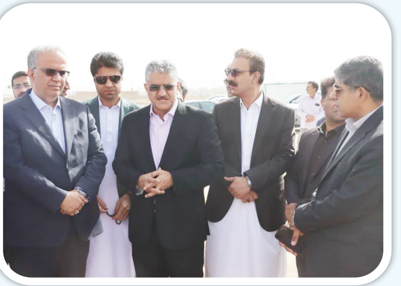
خوب بسپار در اجرای امور فرهنگی، ایجاد غرفه‌ها و بازارچه‌های محلی از دیگر مواردی هستند که در حال انجام ویا در دسترس کاری ما هستند مهندس نغم پناه شهردار زاهدان

مهندس پناه افزود در ادامه اجرای طرح یک بخش از مسجد در مسیر بازرگانی قرار دارد که در راستای اجرای طرح نیاز به توسعه خدمات شهری در این راستا توسط همکاران ما بسته‌های تشویقی هم از ساخت مجدد بنای مسجد در همان محل و اعطای واحد های بازرگانی جهت درآمد پایدار برای مسجد دیده شده است. وی با بیان اینکه بازرگانی بلوار نارالله به میدان کوثر ضمن تسهیل در تردد شهروندان بخش نظارت ترافیکی این محدوده از شهر را به حداقل ممکن برسانیم. شهردار زاهدان، مهمترین مشکل اجرای این طرح را عدم همکاری برخی از صاحبان املاک در مسیر پروژه دانست و افزود شهرداری زاهدان برای آن دست از صاحبان املاک که در مسیر اجرای طرح با شهرداری همکاری نمی‌کنند از طریق اجرای ماده ۹ قانون تملک اقدام خواهد نمود که انتظار ما از شهروندان همکاری جهت اجرای هر چه سریعتر این پروژه است.