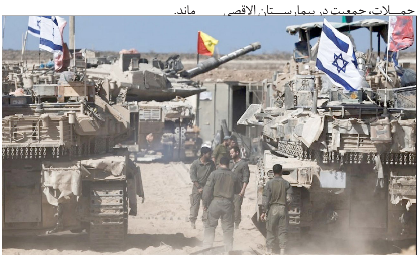
حملات، جمعیت در سما، ستان، الاقصی، ماند.

منیزه مؤذن - گروه بین الملل اسرائیل و حماس پس از کشته شدن دو سرباز اسرائیلی در این منطقه در روز یکشنبه، بار دیگر بر پایبندی خود به توافق تأکید کردند.