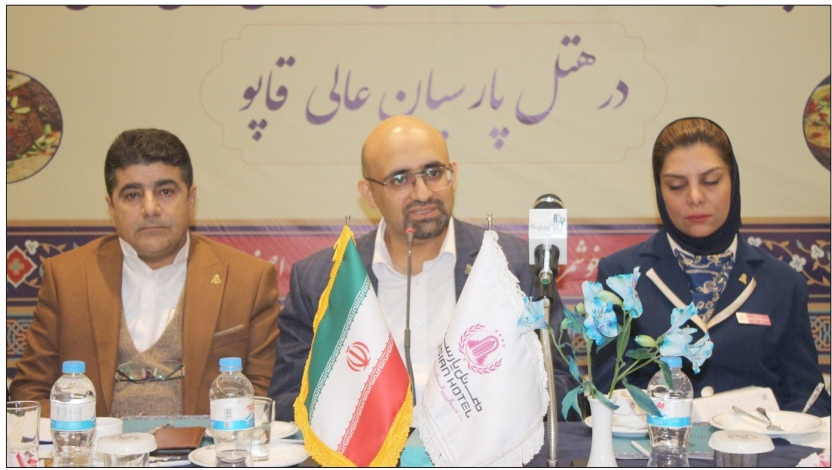
در هتل پارسیان عالی قاپو

خاطر نشان کرد: «این طرح با مطالعه و تحقیق دقیق و همزمان با هفته گردشگری رونمایی شد و امیدواریم سرآغاز حرکتی ماندگار در جهت معرفی ظرفیت‌های گردشگری خوراک اصفهان در سطح ملی و بین‌المللی باشد.»