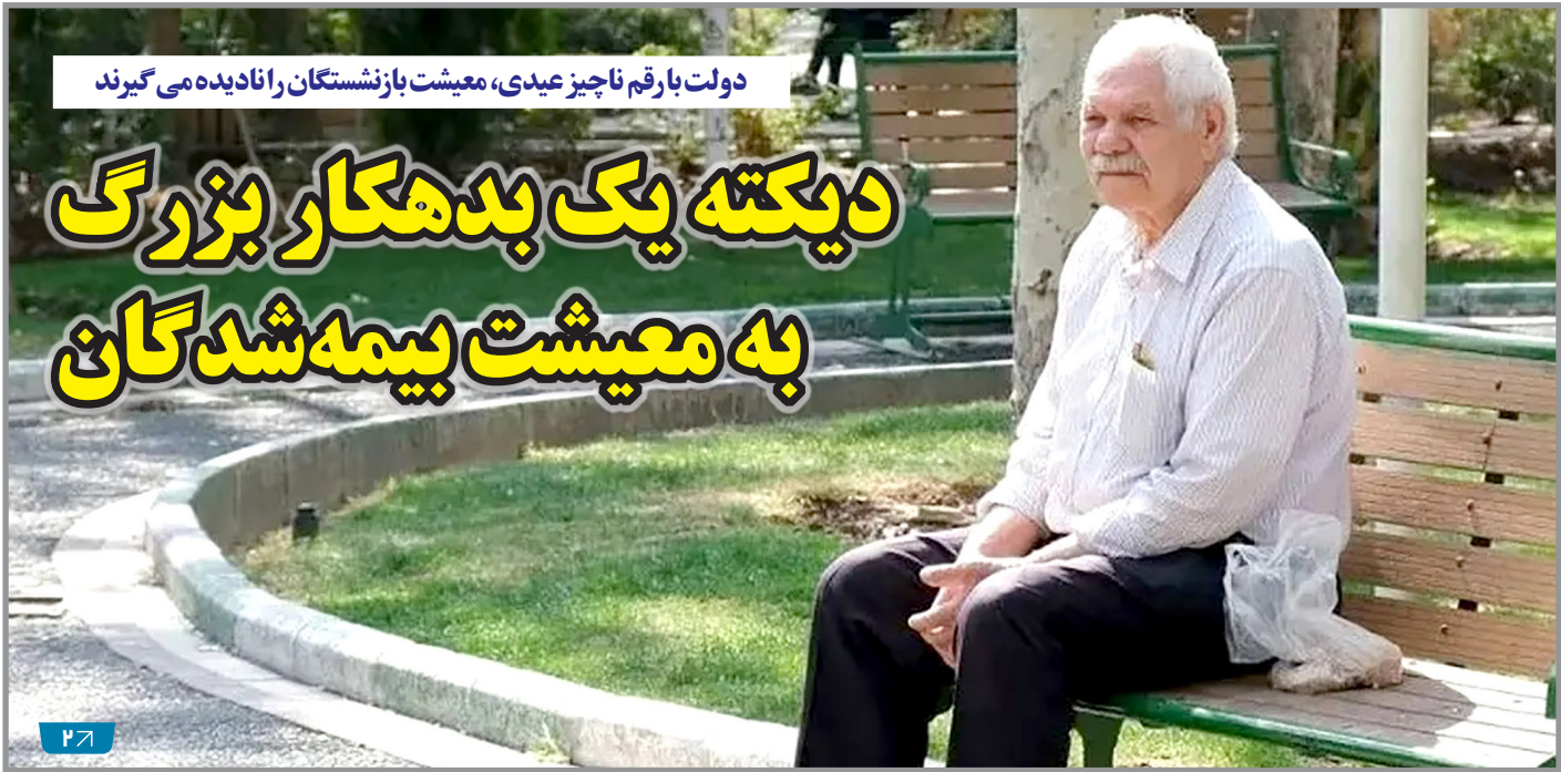
دولت با رقم ناچیز عیدی، معیشت باز تنگسازان را نادیده می‌گیرد