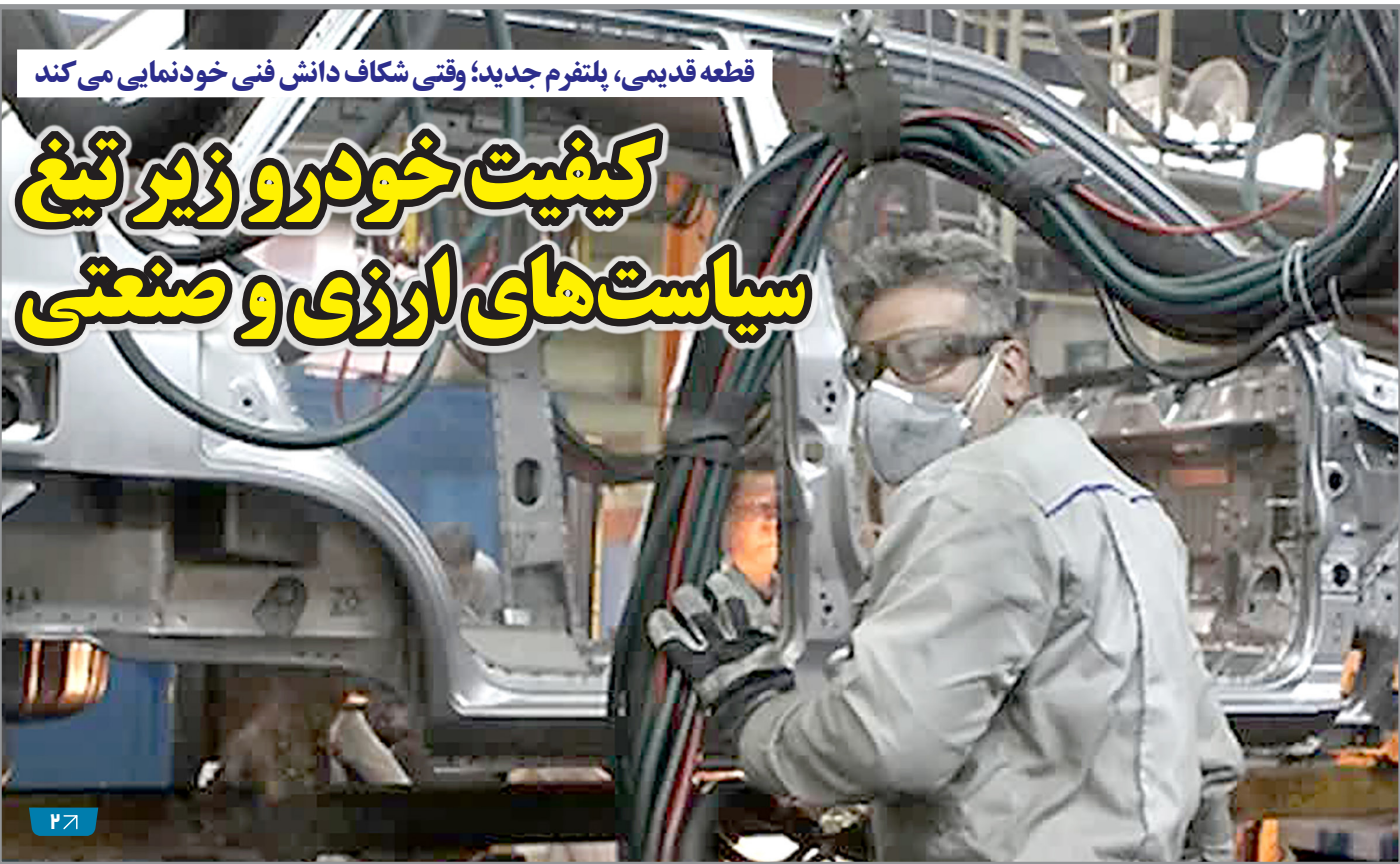
قطعه قدیمی، پلترم جدید؛ وقتی شکاف دانش فنی خودنمایی می‌کند