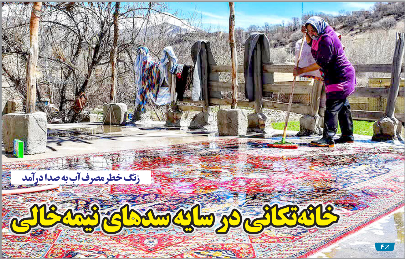
زنگ خطر مصرف آب به صدا درآمد

با فرارسیدن آخرین ماه سال ۱۴۰۴ و افزایش ریسک‌های سیستماتیک در بازار سرمایه، به نظر می‌رسد سهامداران باید هوشمندانه قدم بردارند و با توجه به تحولات سیاسی و اقتصادی کشور، پیش‌فرض‌هایی درستی برای مدیریت دارایی خود داشته باشند.