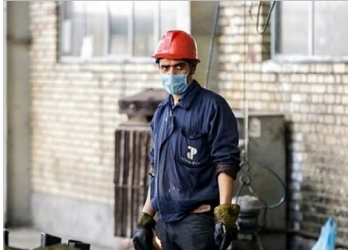
کارگر ساختمانی در تهران

یک اقتصاددان با هشدار نسبت به پیامدهای تداوم وضعیت کنونی اقتصاد کشور اعلام کرد که رشد اندک اشتغال زایی در شرایطی که جمعیت در سن کار رو به افزایش است، به تشدید بیکاری و سخت تر شدن دسترسی به فرصت های شغلی، حتی برای تحصیل کرده ها، منجر شده است. به گفته او، تداوم این روند در سال های اخیر موجب افزایش میل به مهاجرت در میان جوانان و نیروهای متخصص شده و ناامیدی از یافتن شغل مناسب، یکی از مهم ترین