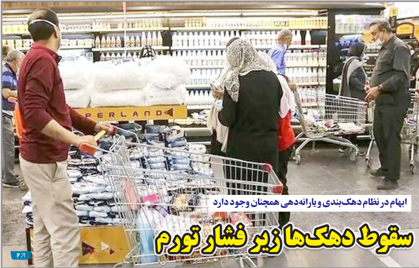
ایهام در نظام دهک بندی و یارانه دهی همچنان وجود دارد