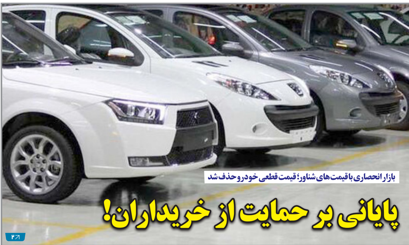
بازار انحصاری با قیمت‌های شاور؛ قیمت قطعی خودرو حذف شد