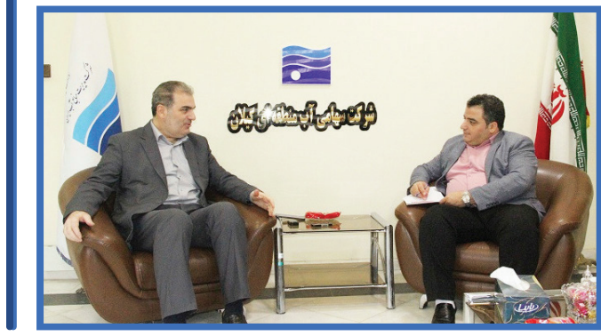
گفت و گوی اختصاصی عصر رسانه با مدیرعامل شرکت آب منطقه ای استان گیلان

آنچه امروز در حوضه مدیریت منابع آب استان گیلان به عنوان یک کارنامه قابل قبول ارائه می شود، حاصل تلاش یک فرد یا یک دستگاه خاص نیست؛ بلکه نتیجه یک هم افزایی گسترده میان تمامی ارکان مدیریتی، کارشناسی و مردمی استان است. واقعیت این است که ما در سال های اخیر، به ویژه در سخت ترین شرایط آبی، در معرض آزمونی جدی قرار گرفتیم. آزمونی که اگر کوچک ترین ناهماهنگی در آن رخ می داد، می توانست تبعات سنگینی برای کشاورزی، معیشت مردم و حتی امنیت